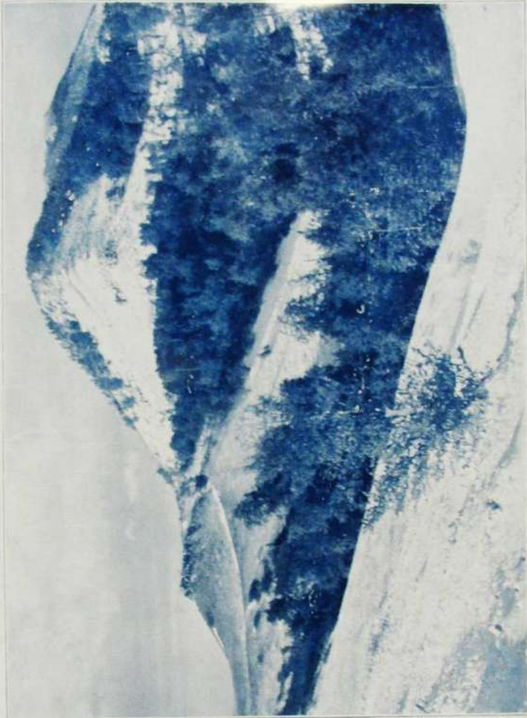
POGLED NA VRH OBRUČA (3777 m) ZIMI.